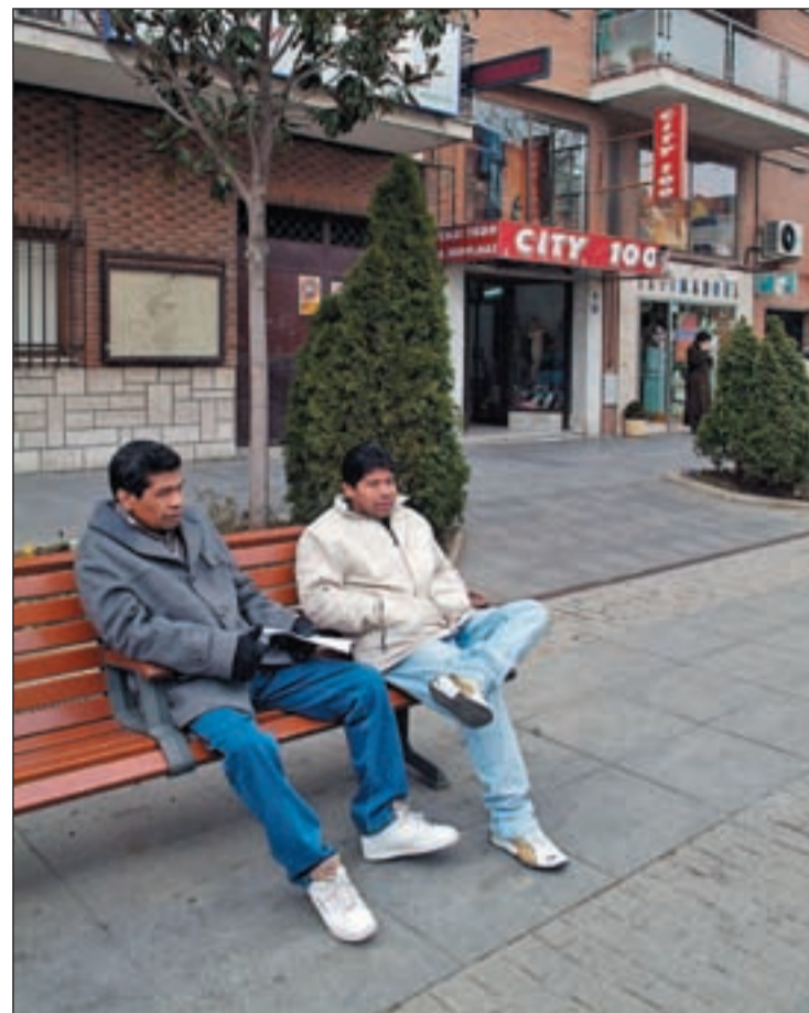
Dos inmigrantes sentados en un banco de Madrid

Según el informe 'Inmigración Internacional 2010' de la Organización para la Cooperación Económica y el Desarrollo