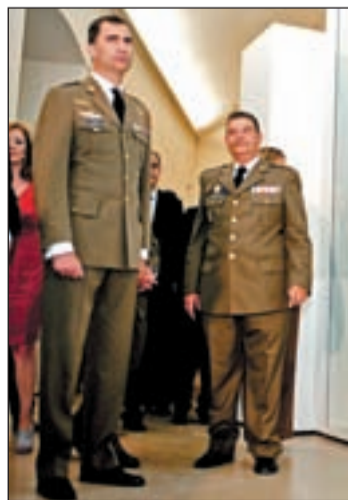
El Príncipe en la inauguración

Al acto acudieron las ministras de Defensa y Cultura, Carmen Chacón y Ángeles González Sinde, respectivamente, así como el presidente de Castilla-La Mancha, José María Barreda, el jefe de Estado Mayor de la Defensa (JEMAD), José Julio Rodríguez, y el jefe de Estado Mayor del Ejército (JEME), general de Ejército Fulgencio Coll. El museo dispone de más de