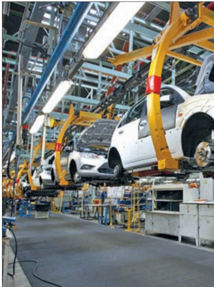
Bienes de equipo y automóvil tiran de nuestra economía

Mientras tanto, la confianza empresarial ha alcanzado ya, en el segundo trimestre, su ma-