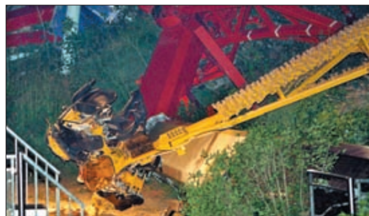
Estado de un brazo de "El Péndulo" tras el accidente

ya han recibido el alta médica, pone en el punto de mira la necesidad de extremar el "control en las atracciones" y "reforzar la seguridad". Aún no hay explicación oficial aunque un fallo en el cálculo del peso de los anclajes de 'El Péndulo' se perfila como causa del suceso.