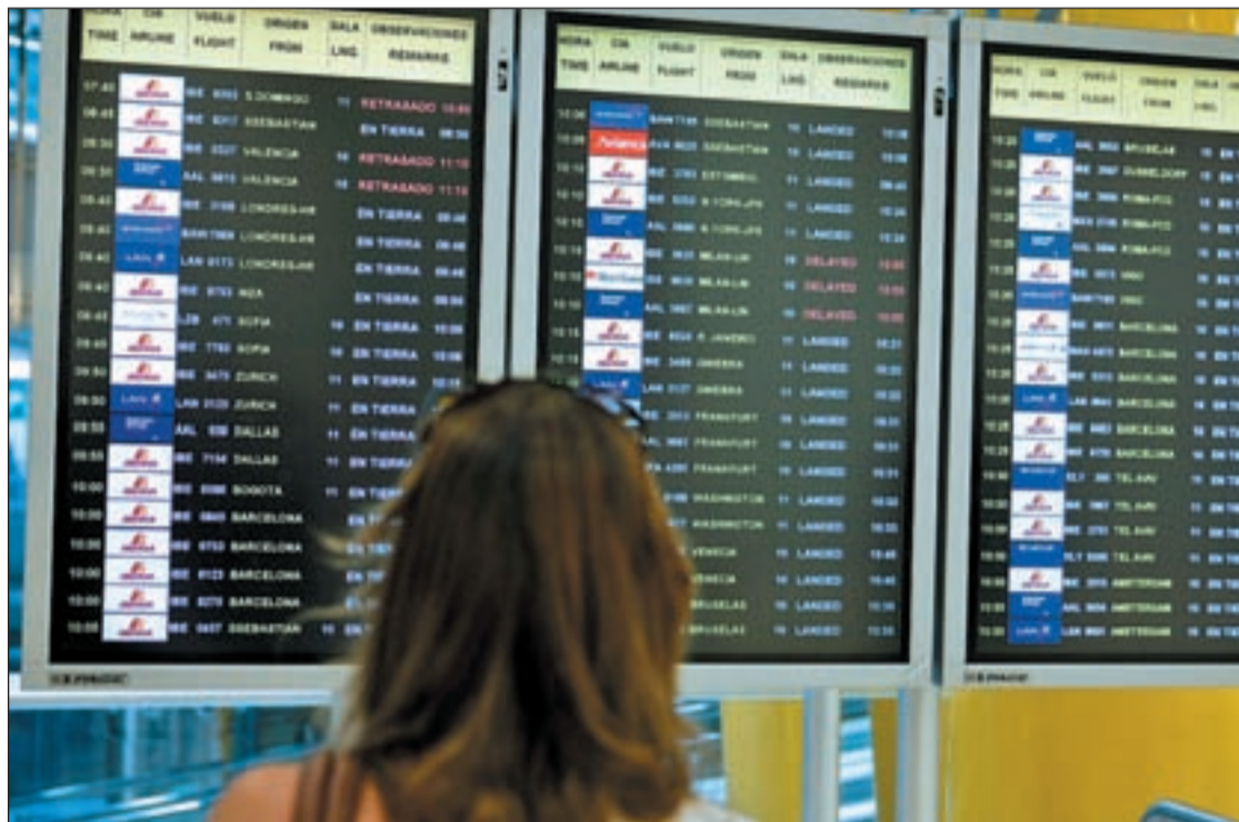
Una chica observa las pantallas que informan de retrasos en el aeropuerto de El Prat hace unos días

La tensión latente ha dado paso al enfrentamiento abierto. Fomento ha lanzado un anuncio en forma de misil a los controladores aéreos civiles ante el alto índice de bajas médicas en las torres y centros de control, como en El Prat de Barcelona. Bajas que según los responsables ministeriales podrían esconder una huelga de celo, algo que niegan rotundamente los controladores. Así, José Blanco ha provocado un verdadero 'tsunami' al informar de que los militares podrían suplir dichas bajas para evitar los consecuentes retrasos en los vuelos ante la falta de personal, al tiempo que hace mella en lo arduo y mediático del conflicto al señalar con afilada dialéctica que "con más dinero, había menos dolores y menos estrés".