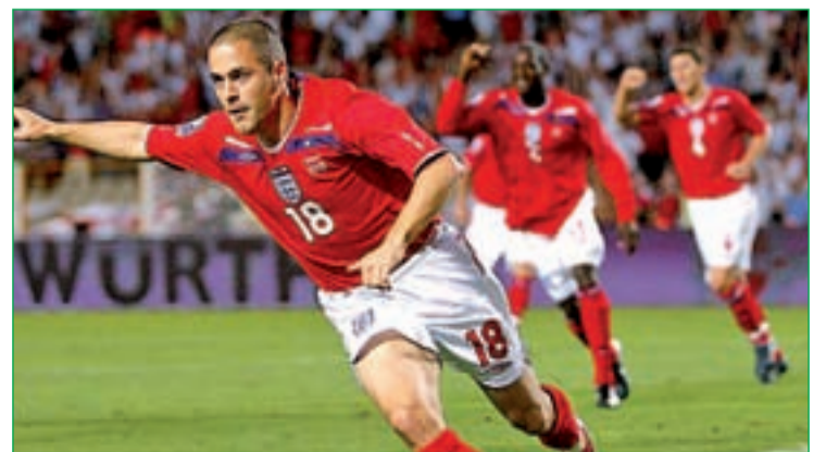
El internacional inglés Joe Cole, uno de los fichajes 'estrella'

Por contra, el Oporto no ha escatimado en los fichajes de Moutinho y James Rodríguez.