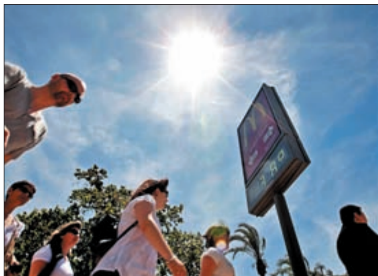
Termómetros al rojo vivo en el centro de Valencia