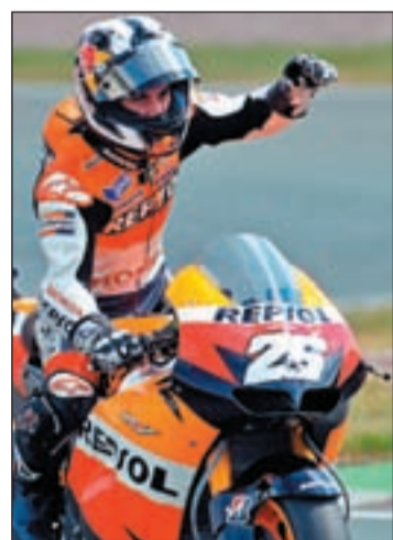
Pedrosa ganó en Sachsenring

Para evitarlo, su compañero de equipo, Valentino Rossi, espera reeditar la actuación de 2008 cuando ganó la carrera tras adelantar en la curva del 'sacacorchos' a Casey Stoner.