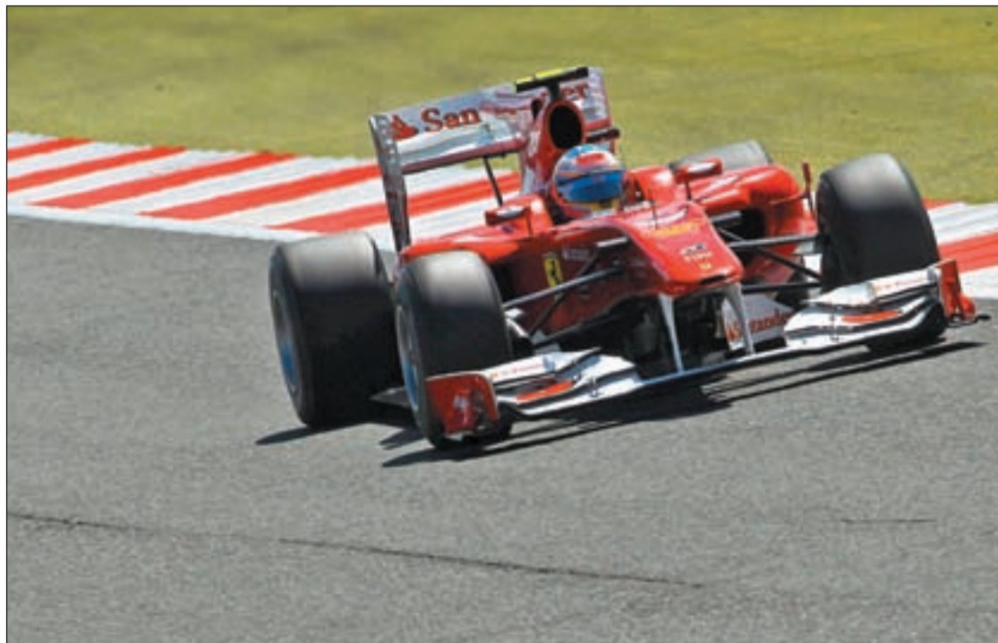
El piloto español sólo pudo ser decimocuarto en Inglaterra

GP DE ALEMANIA TRAS LA POLÉMICA SANCIÓN EN EL CIRCUITO DE SILVERSTONE