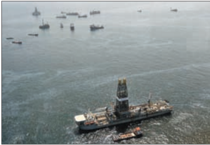
El buque de contención de petróleo Discoverer Enterprise

El Gobierno de Obama ha ordenado a BP “la reapertura de la válvula de contención” que tapona la salida de petróleo “lo más rápidamente posible” en caso de que “se confirme la filtración de hidrocarburos cerca de la boca del pozo”. La petición se ha formulado a través de una carta a la compañía británica que emitió el funcionario del gobierno de EEUU encargado de la limpieza del derrame, Thad Allen. El nuevo derrame ha sido detectado por ingenieros que vigilan el pozo. Además, miembros de la comu-