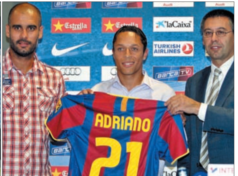
A la izquierda, Pedro León durante su presentación como jugador blanco. A la derecha, el brasileño Adriano en su firma como jugador del Barcelona