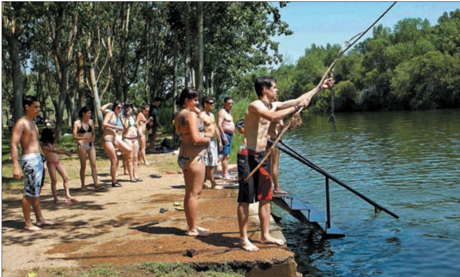
Un grupo de jóvenes después de darse un baño en el río Bullaque en la provincia de Ciudad Real