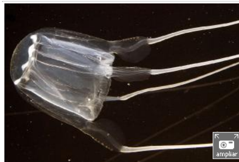
Ejemplar de cubomedusa de la especie Carybda marsupialis .

Ha llegado el momento de superar opiniones subjetivas de uno y otro signo y averiguar con datos científicos en la mano qué es lo que está sucediendo en el mar. Ése es el objetivo de los investigadores del instituto Ramón Margalef de la Universidad de Alicante (UA) y del Instituto de Ciencias del Mar de Barcelona, que desarrollarán en los próximos 60 meses un programa pionero con el apoyo de la Unión Europea para establecer el alcance real del incremento de medusas en el litoral durante los últimos años y constatar si se están produciendo proliferaciones masivas de esta especie.