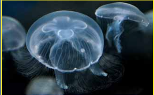
Aurelia aurita medusa común, aurelia

Diámetro: 25 cm Color transparente con 4 herraduras violáceas.