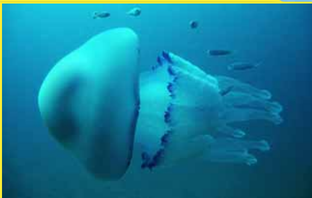
Rhizostoma pulmo aguamala, aguaviva o acalefo azul

Diámetro: 10 - 40 cm Blanca azulada con lóbulos de color violeta.