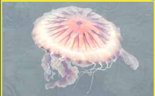
Chrysaora hysoscella medusa de compases o acalefo radiado

Diámetro: hasta 30 cm Color amarillento con 16 bandas marrones.