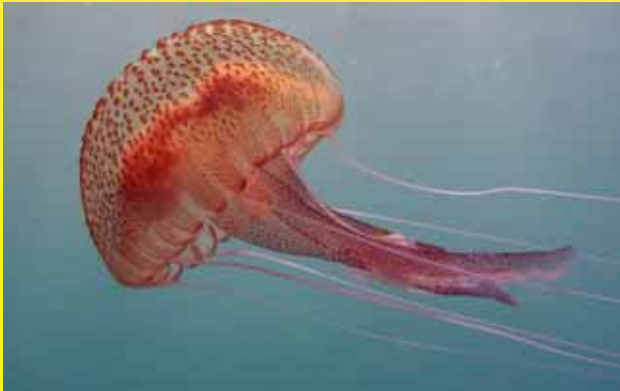
Pelagia noctiluca medusa luminiscente, clavel

Diámetro: 5-20 cm Color rosa con berrugas marrones.