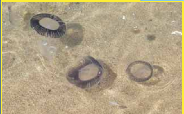
Aequorea forskalea medusa Aequorea

Diámetro: hasta 17 cm Color transparente con una banda de canales radiales de color azul.