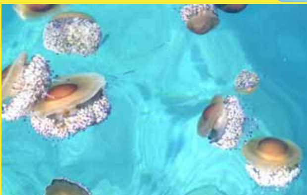
Cotylorhiza tuberculata aguacuajada, medusa huevo frito

Diámetro: 20-35 cm Color marrón amarillento con una gran protuberancia central pardo anaranjada.